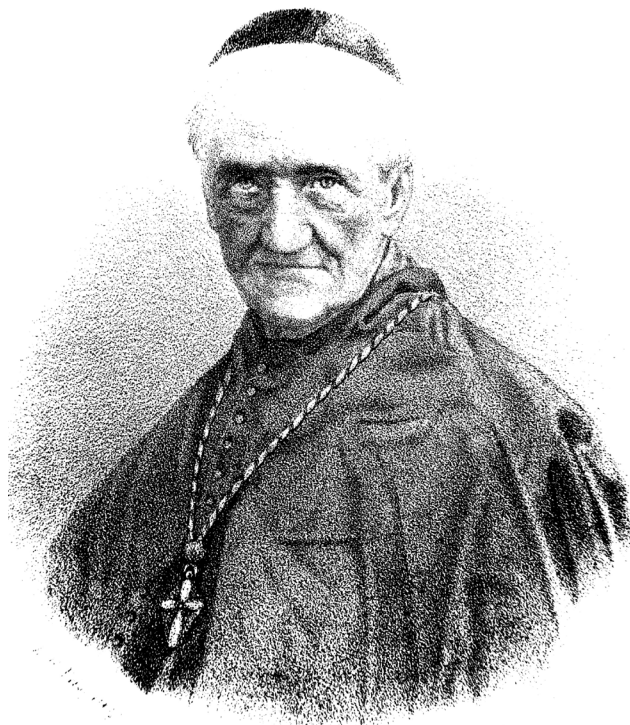
Don Pedro Espinosa y Dávalos, último obispo y primer arzobispo de Guadalajara

Miscelánea (1831-1832). Tomos I y II de varias doctrinas morales, costumbres, observaciones y otras noticias pertinentes al curato de Iztacalco, Universidad Autónoma Metropolitana: 360