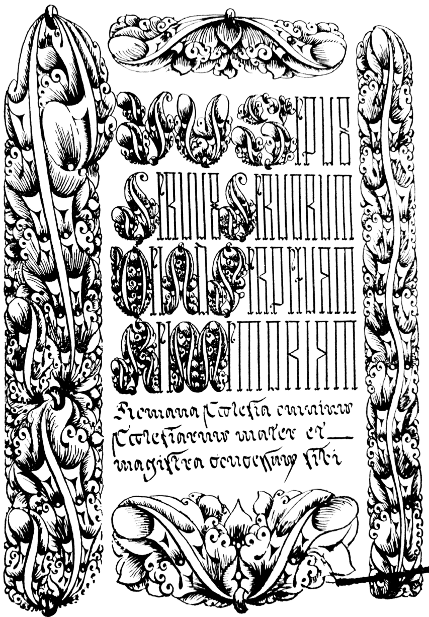
Carátula de la bula Romana Ecclesia, mediante la cual fue creada la Provincia Eclesiástica de Guadalajara en 1863